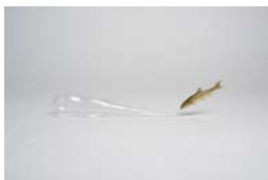
Souffle , 2014 Goujon taxidermisé, verre soufflé 39 x 5,5 cm

Pour son exposition à La Mauvaise Réputation, Olivier Leroi présente une série d'œuvres sculptures et dessins.