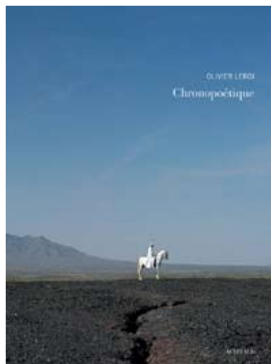
Chronopoétique , 2015 Monographie, éditions Actes Sud Textes d'Olivier Kaepelin Emmanuel Pierrat Yves-Marie Paulet Gilles Tiberghien broché, 19,6 x 25,5 cm, 200 pages 120 illustrations quadri