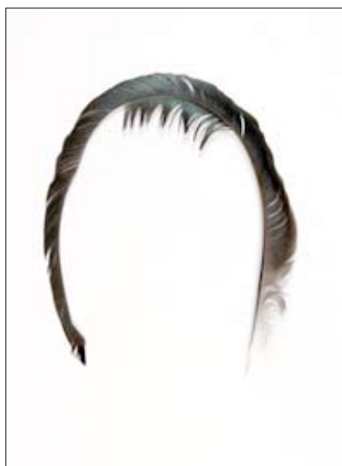
Frange , 2005 Plume de coq découpée 30 x 25 cm